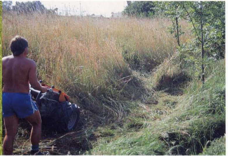
Wendige Balkenmäher erleichtern die Arbeit