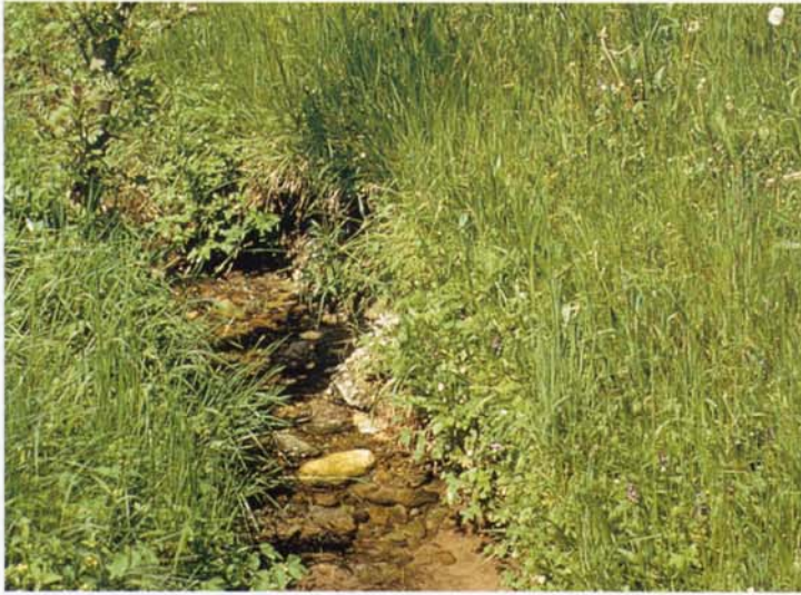
Ab Mitte Juni kann hier mit dem Sommerschnitt begonnen werden