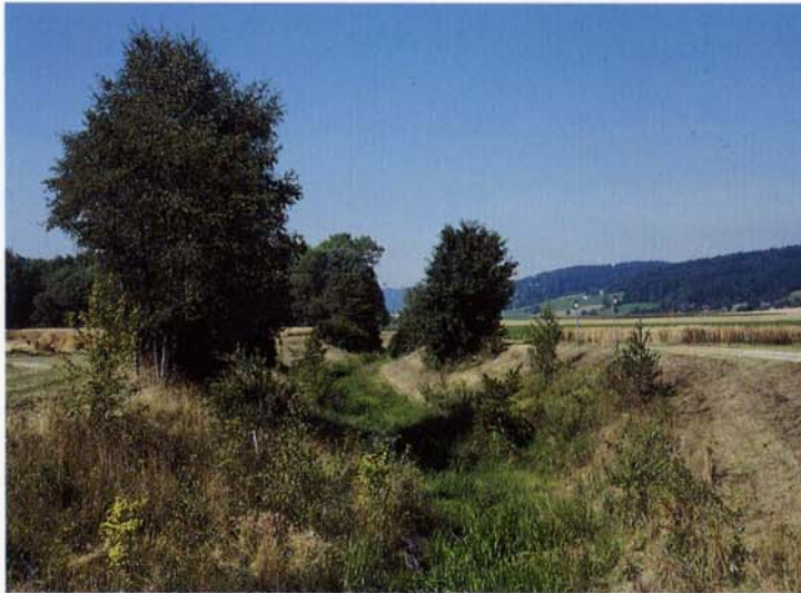
Gemähte und ungemähte Flächen schaffen abwechslungsreiche Strukturen