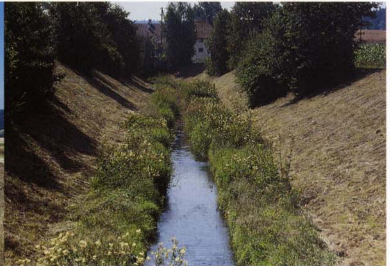
Kleintieren bietet der Ufersaum Unterschlupf und Nahrung