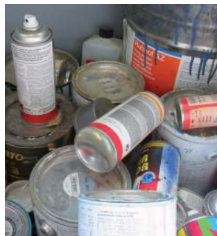
Sonderabfälle gehören nicht in den Kehrichtsack.

Bei Wartungsarbeiten fallen Sonderabfälle wie Altöle, Farbreste und -stäube etc. an. Schiffsbatterien, Reste von Farben oder Antifoulings können zur Entsorgung an die Verkaufsstelle zurückgebracht werden. Andere Sonderabfälle müssen aufgrund ihrer Zusammensetzung separat bei einem autorisierten Sonderabfallempfängerbetrieb entsorgt werden. Wir empfehlen, die entsprechenden Entsorgungsquittungen während mindestens fünf Jahren aufzubewahren. Ölhaltiges Bilgenwasser darf nur in dazu eingerichteten Häfen oder Bootswerften entsorgt werden.