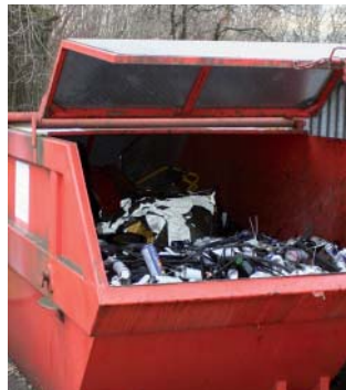
zwischengelagerte Abfälle in einer gedeckten Mulde

Auf öffentlichem und privatem Grund dürfen keine Abfälle im Freien abgelagert oder stehen gelassen werden. Dies gilt insbesondere für ausgediente Teile aus Metall oder Kunststoff. Abfälle sind entweder in gedeckten dichten Mulden oder unter Dach zwischengelagert. Abfälle, die mit wassergefährdenden Flüssigkeiten wie z.B. Öl oder Lösungsmittel verschmutzt sind, müssen in einer dichten, gedeckten Mulde oder in einem abflusslosen Raum gelagert werden.