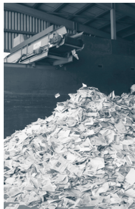
Die Kosten der Papiersammlung werden aus der Grundgebühr gedeckt.