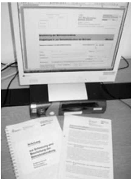
Hilfsmittel zur Selbstdeklaration der Inhaber.

Im 1. Paket 2005 laufen die Abklärungen in den Gemeinden Bülach, Hinwil, Horgen, Kilchberg, Kleinandelfingen, Marthalen, Nürensdorf, Opfikon, Rüm- lang, Rüslikon, Volketswil und Walli-