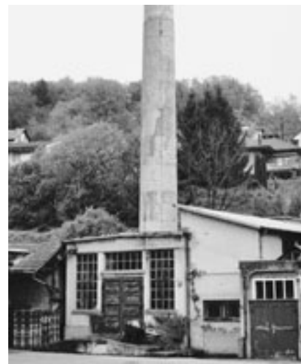
Mit dem Kataster der belasteten Standorte (KbS) sollen alle Standorte erfasst werden, die mit Abfällen belastet sind.